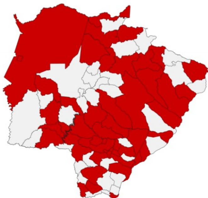
Distribuição Espacial dos Casos Confirmados de COVID-19 - MS

Secretaria de Estado de Direitos Humanos, Assistência Social e Trabalho Superintendência da Política de Assistência Social | VIGILANCIA SOCIOASSISTENCIAL